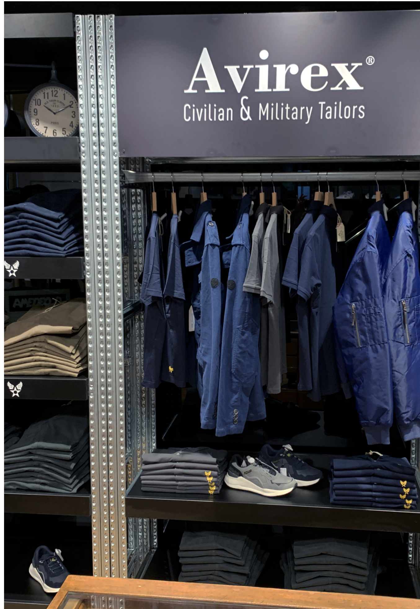
Avirex corner Coin